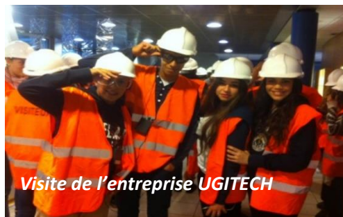
Visite de l'entreprise UGITECH