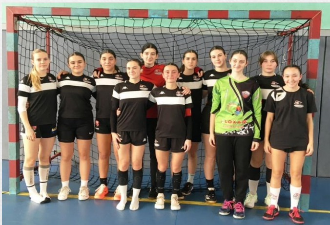
Equipe Fille 2023-24 qualifiée pour la Finale Académique UNSS-Excellence