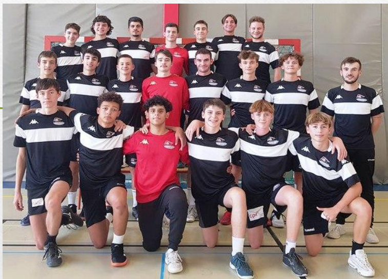
Equipe Garçons - Année scolaire 2023-24

Date limite de retour des dossier : Lundi 1 er Avril 2024.